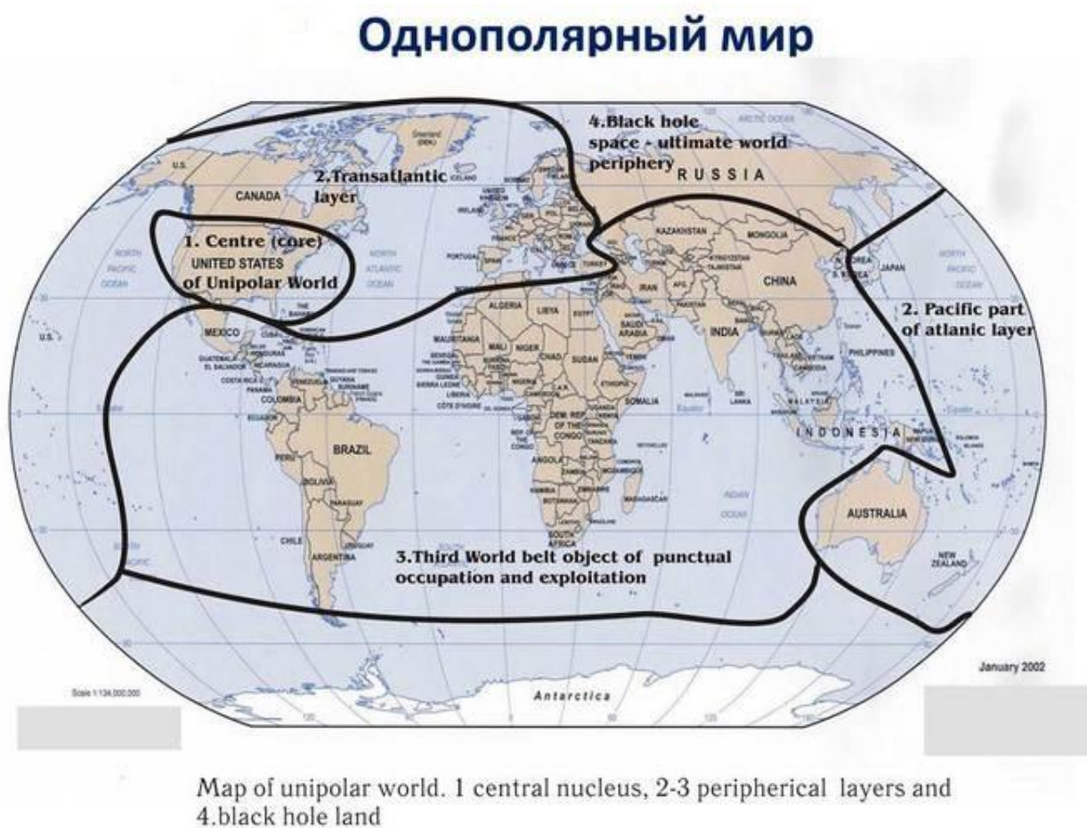
Рис.1 Схема однополярного мира.

Основываясь на данных убеждениях, А.С. Панарин, как учёный, разработал «прогностические сценарии» перехода «немыслимых крайностей однополярного мира» (рис.1), сооружаемого с помощью идеологии либерализма.