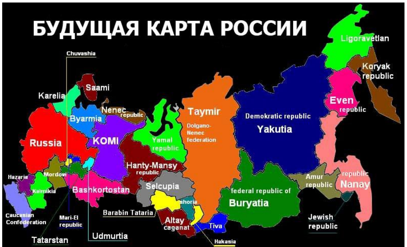
Рис.4 Будущая карта России (европейский взгляд).

Планы столкновения Китая и России вынашиваются уже давно. В том числе прогнозируются итоги такого столкновения (рис. 5), не внушающие оптимизма для россиян.