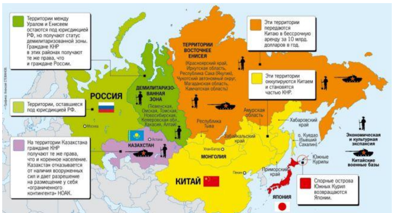
Рис.5 Итоги войны России и Китая.

Планы столкновения Китая и России вынашиваются уже давно. В том числе прогнозируются итоги такого столкновения (рис. 5), не внушающие оптимизма для россиян.