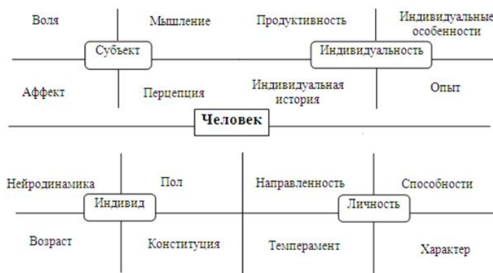
Рисунок. Психологическая структура человека (индивид, субъект, личность, индивидуальность)

Внимательно рассмотрите рисунок «Психологическая структура человека», предложенный В.А. Ганзеным, и письменно ответьте на предложенные вопросы, заносите ответы в конспект: