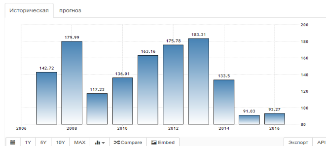
Украина - ВВП