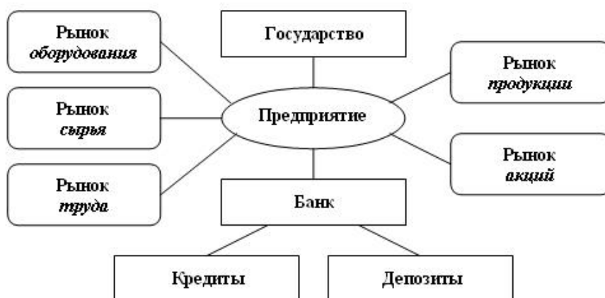
Рис. 1.2. Рыночное окружение Предприятия

На рынках оборудования и сырья Предприятие приобретает соответствующие средства производства. Там предлагается несколько их типов по каждому виду продукции. Пользователю придется выбирать между «дорогим и хорошим» и «дешевым, но похуже» (см. п.п. 2.1, 2.2). На этих же рынках продается списанное оборудование и ненужное сырье (см. п.п. 2.7, 2.8).