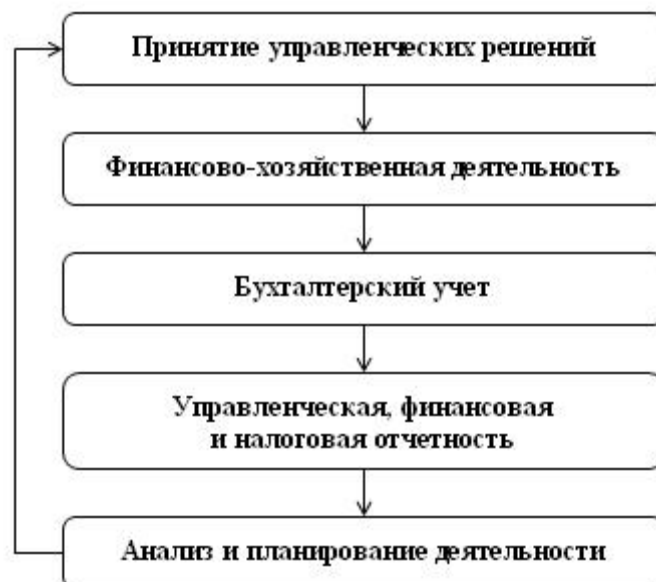
Рис. 1.3. Процесс управления Предприятием

Главную роль в сборе, регистрации и обобщении информации о деятельности предприятия играет бухгалтерский учет. Пользователь может наглядно наблюдать, как принятые им управленческие решения преобразуются в результаты деятельности и как эти результаты отражаются в учете по принципу двойной записи в соответствии с требованиями российского законодательства. О разделах программы, посвященных бухгалтерскому учету, рассказывается в главе 4 настоящего пособия.